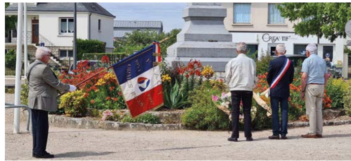
18 juin : Cérémonie de l'Appel du 18 juin, place Clovis Vincent.