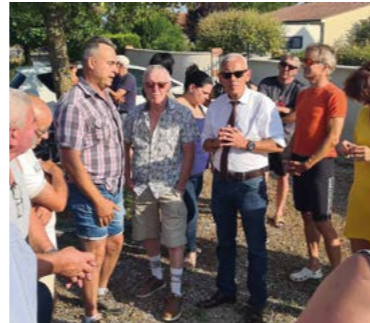
12 juillet : Réunion publique route de la Chapelle.