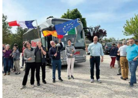
19 mai : Accueil des Délégations Allemande et Italienne.