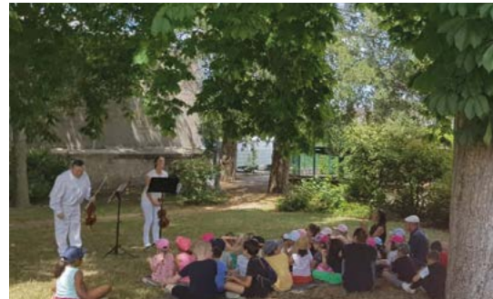
12 juillet : 1 ers spectacles hors les murs au square Joseph Haladyn et au square des jardins du bourg.