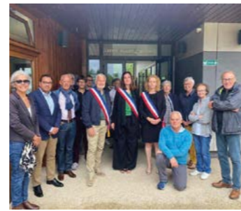
3 juillet : Échange entre élues et citoyen.nes sur le respect des valeurs républicaines à la Mairie de Combleux.