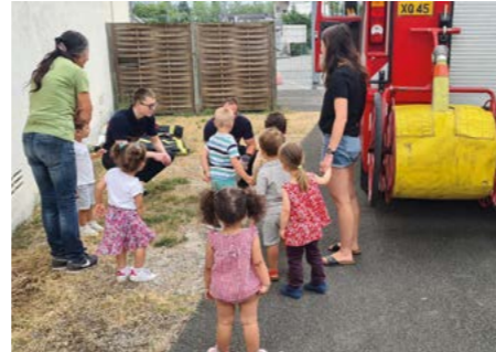
29 juin : Des pompiers à la Halte-garderie pour la présentation des métiers aux tout-petits.