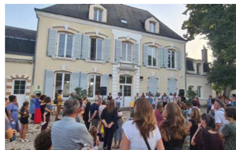
6 septembre : Réunion de rentrée « parents-profs » à l'École Municipale de Musique.