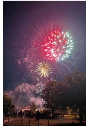
14 juillet : Fête nationale et retraite aux flambeaux.