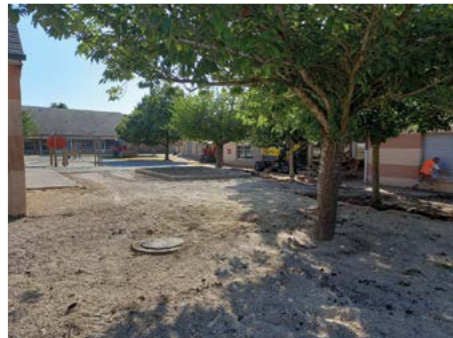
Les cours Oasis sur le site de l'école du Moulin.