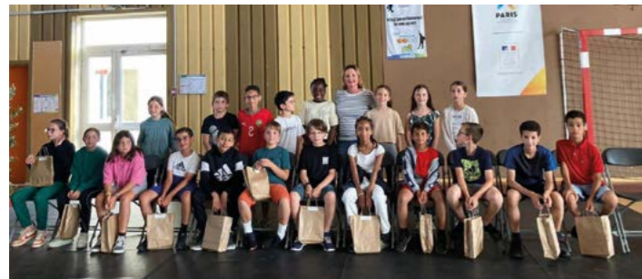
5 juillet : Quelques heureux bénéficiaires de la cérémonie des CM2... Dernières heures de primaire : l'année prochaine, ils se retrouveront au collège !