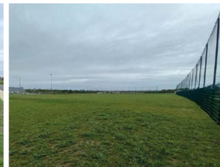
Réalisation d'un nouvel accès aux bois et mares de Lazin.