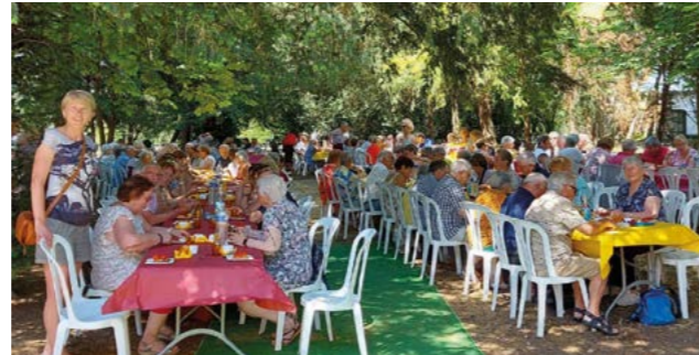
17 juin : Avec le retour des beaux jours, l'IRA reprend ses activités extérieures. La traditionnelle Guinguette est de retour au Parc de Bel Air.