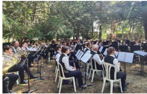
2 juillet : Concert d'été de l'Harmonie Municipale.