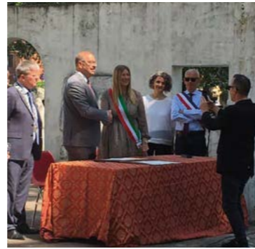
2 juin : Les Maires de Castel-Maggiore et de Drensteinfurt on signé ensemble la Charte de l'Amitié entre leurs deux villes à Castel-Maggiore.