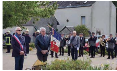
30 avril : Cérémonie en hommage aux victimes de la Déportation.

19 mai : les trois Maires et de nombreux Ingréens ont inauguré la nouvelle plaque de nos deux jumelages en entrée de ville et rappelé l'importance de nos relations pour construire l'Europe du citoyen.