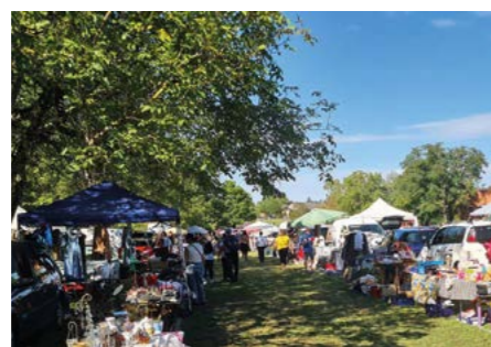
2 et 3 septembre : La Saint Loup fête ses 100 ans. Vide grenier, fête foraine, feu d'artifice, animations tout le week-end.