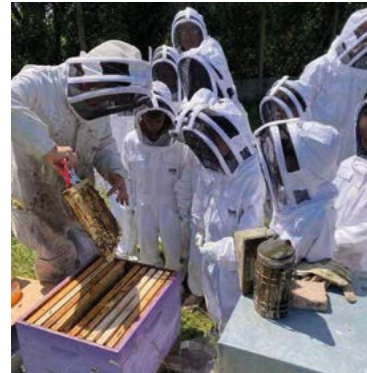
26 mai : Les élèves d'Ingré ont participé à la production de miel au Rucher pédagogique de la ville.