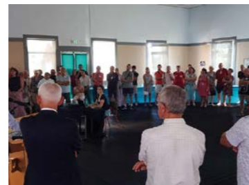
9 septembre : Accueil des responsables associatifs puis des nouveaux habitants avant le Forum des Associations.