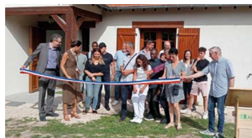
6 septembre : Inauguration d'une unité résidentielle pour jeunes adultes souffrant de troubles autistiques.