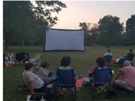
7 juillet : Ciné plein air dans la douceur d'une soirée d'été.