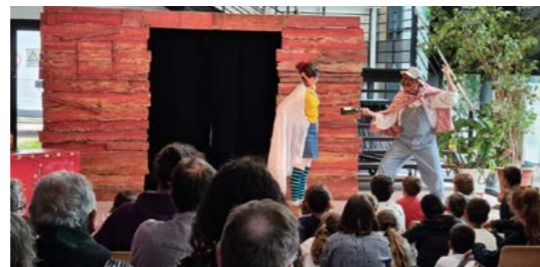
30 août : « Les vies d'Ulysse » racontées aux jeunes et moins jeunes par la Compagnie KRIZO Théâtre.