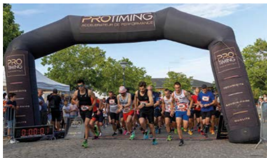
2 juillet : Ingré fête le sport. Départ des Échappées Ingréennes le vendredi soir, puis c'est le tour des cyclistes avec départ de la balade familiale du dimanche.