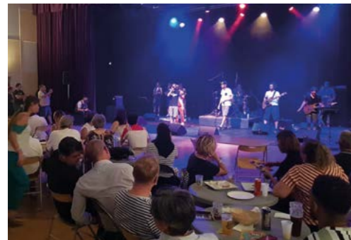
9 juin : Festi, 1 ère édition du nouveau festival ingréen.