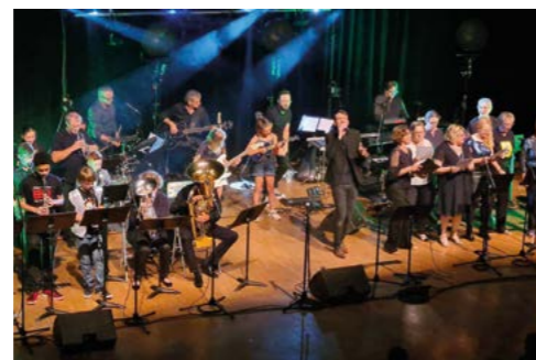
23 juin : Spectacle des élèves de l'École Municipale de Musique avec le groupe Artamuse.