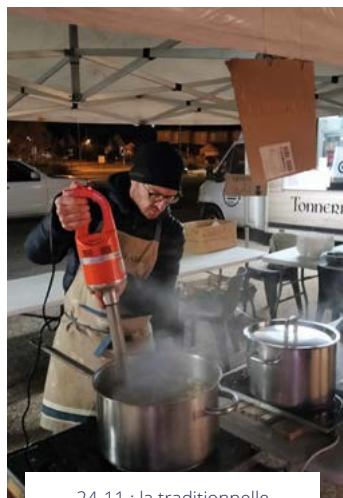
24-11 : la traditionnelle Disco-Soupe du marché d'Ingré pour utiliser les légumes récupérés.