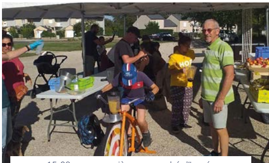
15-09 : une première au marché d'Ingré : le vélo spécial « disco-smoothie ».