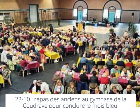
23-10 : repas des anciens au gymnase de la Coudraye pour conclure le mois bleu.