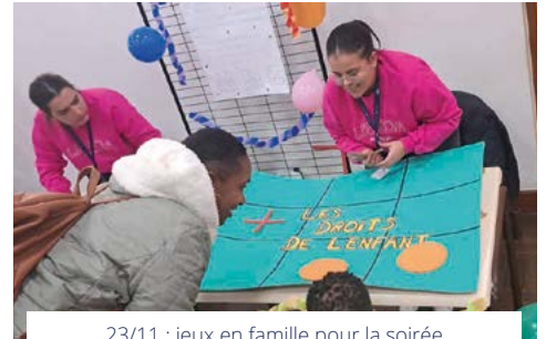
23/11 : jeux en famille pour la soirée des droits de l'enfant à la salle des fêtes Jean Zay.