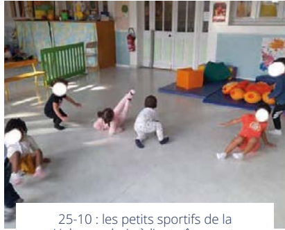
25-10 : les petits sportifs de la Halte-garderie à l'entraînement. Objectif JO 2024 !