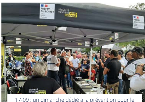
17-09 : un dimanche dédié à la prévention pour le responsable de la Police Municipale d'Ingré.