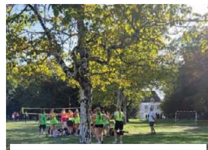
13-10 : 316 lycéennes du département ont couru « la Lycéenne » au parc de Bel Air avec l'UNSS.