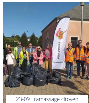
23-09 : ramassage citoyen autour du collège et du lycée.