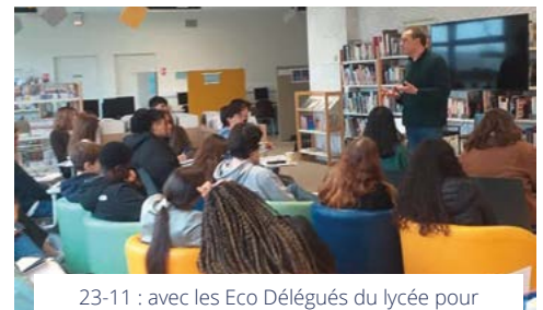
23-11 : avec les Eco Délégués du lycée pour évoquer des actions de solidarité et de protection de l'environnement.