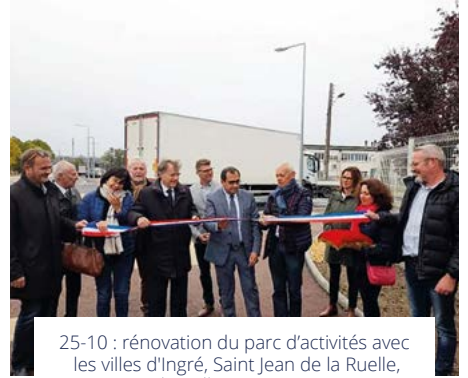
25-10 : rénovation du parc d'activités avec les villes d'Ingré, Saint Jean de la Ruelle, La Chapelle Saint Mesmin.