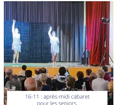
16-11 : après-midi cabaret pour les seniors.