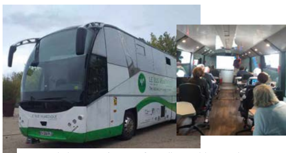
19-10 : le bus numérique a fait salle comble pour les deux sessions proposées.

Retrouvez les photos sur facebook : ville d'Ingré