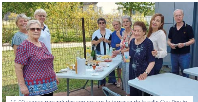
15-09 : repas partagé des seniors sur la terrasse de la salle Guy Poulin.