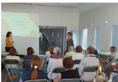
10-10 : atelier « bien manger » : un médecin et une infirmière accompagnent les seniors.