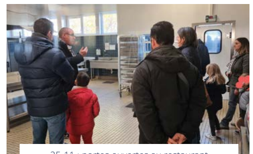
25-11 : portes ouvertes au restaurant scolaire municipal.