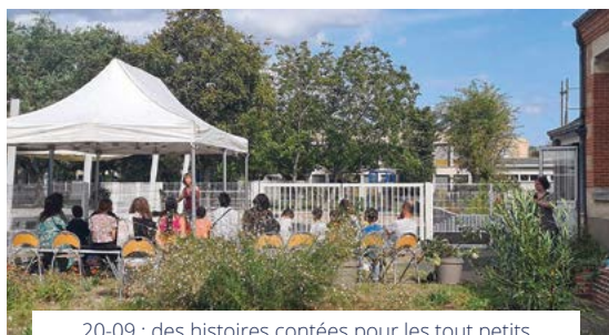
20-09 : des histoires contées pour les tout petits devant la bibliothèque.