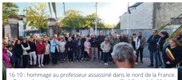
16-10 : hommage au professeur assassiné dans le nord de la France. De nombreux Ingréens sont venus se recueillir à l'appel du Maire contre l'intégrisme aveugle et pour les valeurs républicaines : liberté, égalité, fraternité, laïcité et tolérance.