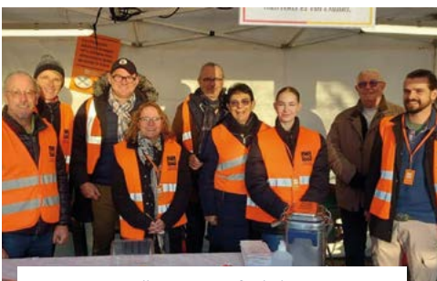
25-11 : collecte au profit de la Banque Alimentaire du Loiret devant le magasin Carrefour Market d'Ingré. Un geste de solidarité essentiel.