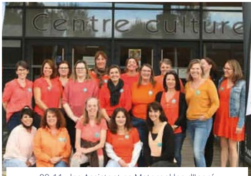
09-11 : les Assistant.es Maternel.les d'Ingré à leur 6 ème rencontre professionnelle de la métropole à Fleury-les-Aubrais