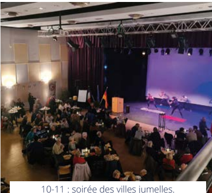
10-11 : soirée des villes jumelles.