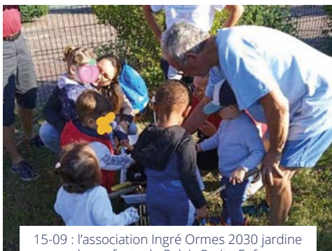
15-09 : l'association Ingré Ormes 2030 jardine avec les enfants du Relais Petite Enfance.