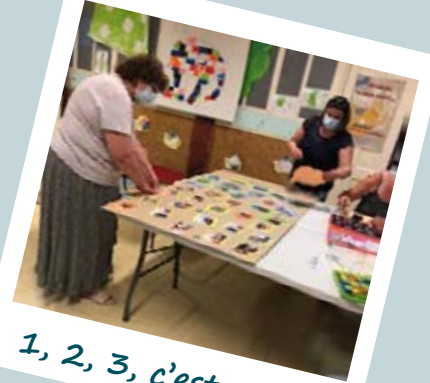
1, 2, 3, c'est parti