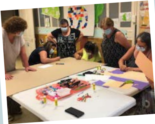
Préparation de l'expo photos