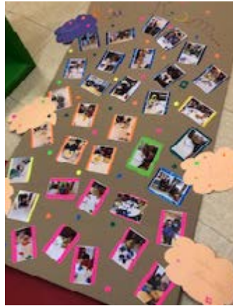
Que de beaux souvenirs !!!