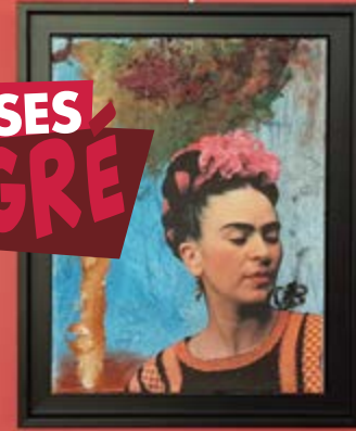
© Œuvre réalisée par « Christine Béranger » atelier peinture Phosphène