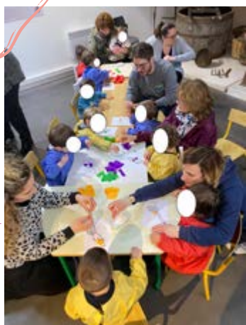
Sortie au musée de la polyculture 08/04/2022