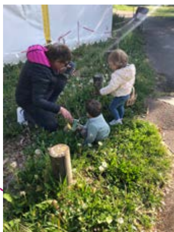
Chasse aux oeufs 27/04/2022