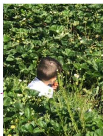
Sortie pédagogique à la ferme de Gidy - cueillette de fraises